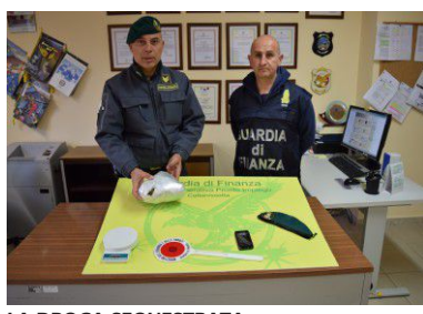
LA DROGA SEQUESTRATA

I "Baschi Verdi" del Gruppo della Guardia di Finanza hanno tratto in arresto un nigeriano di 22 anni (O. E. le iniziali) che aveva oltre mezzo chilo di marijuana. Il giovane è stato intercettato dopo che, proveniente da Palermo con mezzi pubblici, si dirigeva verso il centro storico. La sostanza stupefacente era occultata all'interno di uno zainetto. La marijuana sequestrata al nigeriano, del valore di oltre