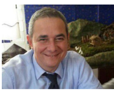
L'ON. MICHELE MANCUSO

sulle singole fasi della filiera. «Cogliamo con favore l'appello dell'ordine dei dottori Agronomi e Forestali della provincia di Caltanissetta. Proprio in questi giorni stiamo lavorando a un incontro che a breve renderemo pubblico, coinvolgendo sia l'Ispettorato agrario e l'ordine degli agronomi ma soprattutto garantendo la presenza dell'Assessore dell'agricoltura e dello sviluppo rurale, Edy Bandiera, per