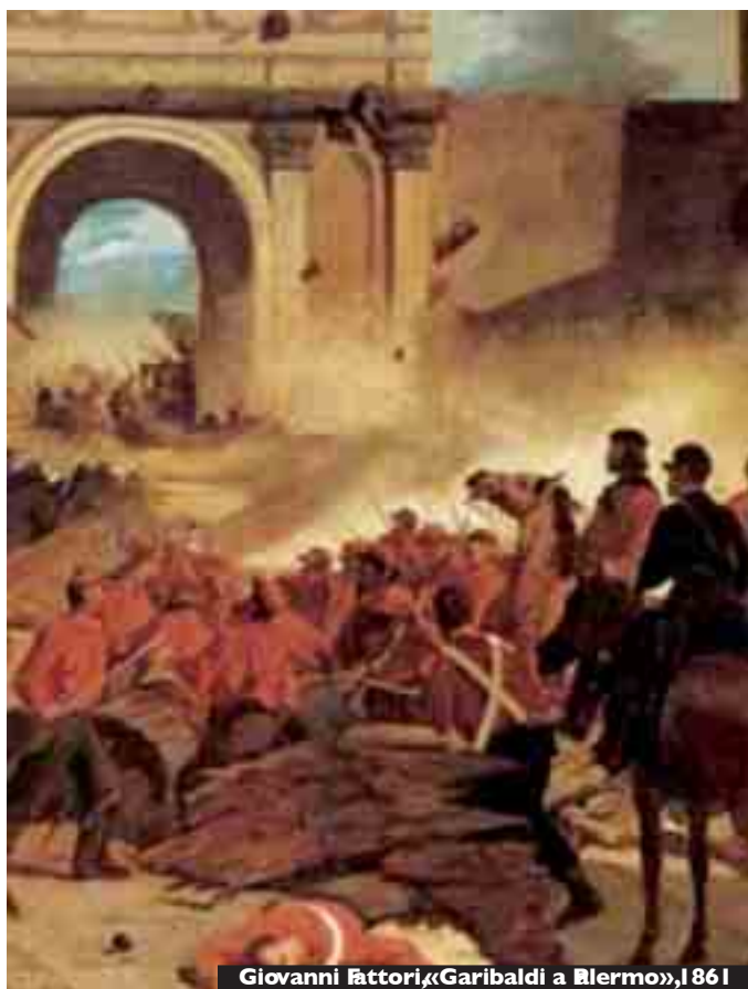
Giovanni Fattori, «Garibaldi a Palermo», 1861