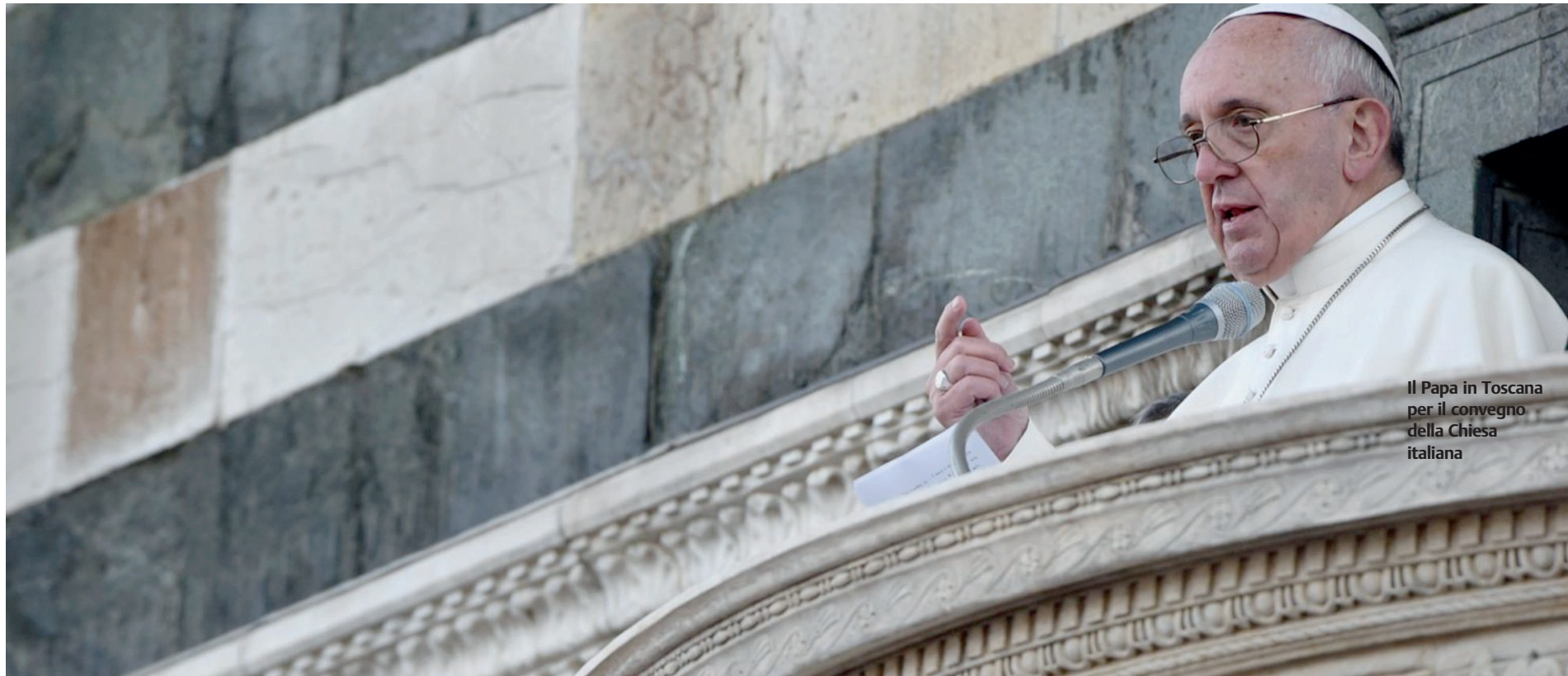
Il Papa in Toscana per il convegno della Chiesa italiana

Il dibattito. Due convegni (uno a San Cataldo e l'altro a Roma) ripropongono l'urgenza di non lasciar cadere l'invito del Pontefice a un rinnovato impegno nel sociale. Chissà che questo appello se preso sul serio non possa avere la stessa efficacia paradigmatica che ebbe, più di un secolo fa, l'indicazione di «uscire fuori di sagrestia» di Leone XIII