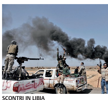
SCONTRI IN LIBIA

ropa, si può imbastire un'altra guerra. Siamo alla vigilia di un altro conflitto che tanto locale non sarà, e proprio davanti alla Sicilia? E i potenti della terra che fanno, aspettano i residui guizzi di Obama, oppure l'intronizzazione di quell'evasore fiscale eletto presidente Usa? Qui si rischia grosso e nessuno ne parla, forse perché tutti si sono convinti che ormai la Libia sarà divisa in due e che in Cirenaica ci sarà la dominazione russa più o meno camuffata. Oggi chi è in grado di affrontare Haftar? Nel frattempo noi ci occupiamo di quisquiglie. Ad esempio ci pare sempre più che l'Italia nella Ue sia considerata il muro basso dove si appoggiano tutti. Non si capisce ad esempio perché Bruxelles ci faccia la ramanzi-na sul bilancio di milioni di miliardi chiedendo una correzione di 3,2 mi-