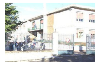
LA SCUOLA DON MILANI

Don Milani: parole emozioni e creatività