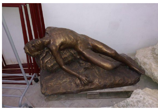
LA STATUA IN BRONZO DENOMINATA MINATORE MORENTE

«Valorizzare la statua in bronzo di Scarantino»