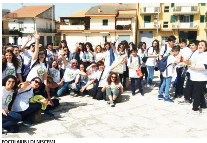
FOCOLARINI DI NISCEMI

Il programma della missione di evangelizzazione comprende per i lunedì 2, 9 e 16 e per mercoledì 4, 11 e 18 ottobre, l'istituzione di Centri di ascolto nelle vie Lumia 15, Quintino Sella 15, Torricelli 71, Giotto 11, Giordano Bruno 28, Vito Schifani 1, Ettore Majorana 66, Indro Montanelli 3, Cimabue 104 e Torricelli 153. Il mandato e l'invio dei missionari, è previsto domenica alle 18.30 in parrocchia, dove venerdì 6 ottobre alle 20, si terrà un incontro per una "Spiritualità vocazionale". Sono in programma altri