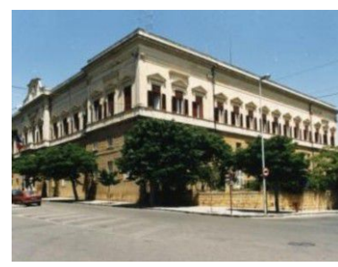
LA SEDE DEL LIBERO CONSORZIO